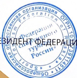
С. М. МИРОНОВ